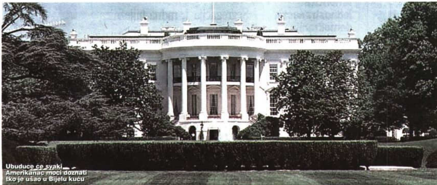
Ubuduće će svaki Amerikanac moći doznati tko je ušao u Bijelu kuću

Za Hrvatsku bi pravi iskorak bilo već i stvaranje registra lobista kakvi odavno postoje u Washingtonu i Bruxellesu